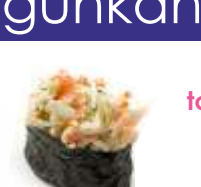
3€70 surimi-tako Krebsfleisch, Oktopus, jap. Mayonaise