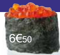
6€50 ikura Lachskaviar