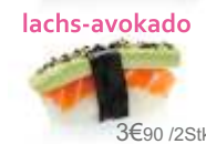
3€90 / 2Stk.