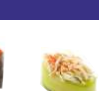
3€20 surimi-kappa Krefleisch, Gurke, jap. Mayonaise