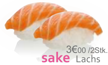
3€00 / 2Stk. sake Lachs